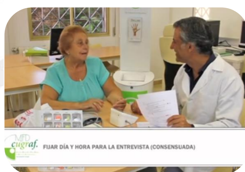
Servicio de Seguimiento Farmacoterapéutico