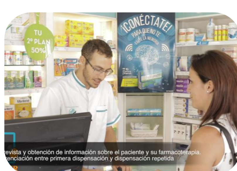
Servicio de Dispensación