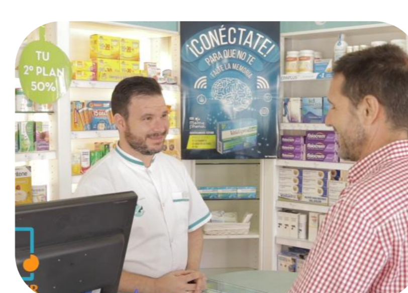
Servicio de Indicación Farmacéutica